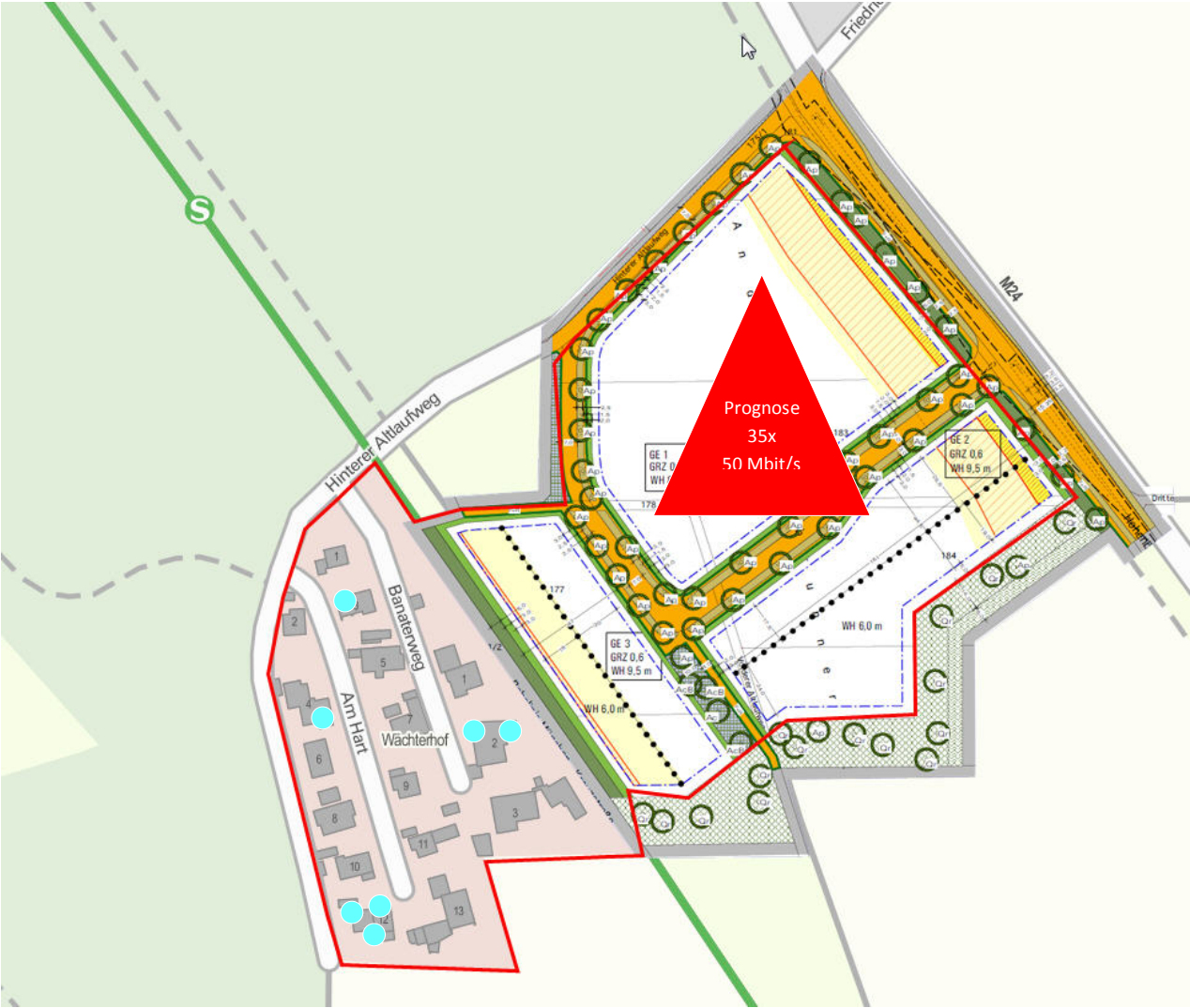
Karte Prognose und vorhandener Meldungen im Kumulationsgebiet

09.02.2014 | Gemeinde Höhenkirchen-Siegertsbrunn, Rosenheimer Str. 26, 85635 Höhenkirchen-Siegertsbrunn